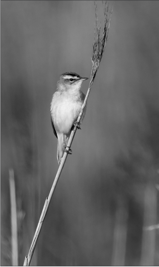
La migration du Phragmite des joncs débute en juillet et culmine en août, mais connaît un regain début septembre.