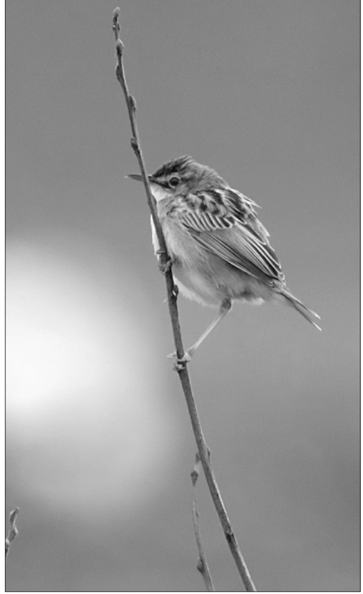
La saison de reproduction de la Cisticole des joncs est très longue, avec de nombreux couples encore actifs en août et septembre.

PDV). Le premier nid signalé contient 3 œufs le 24/03 à Bénéjacq (JIG). L'espèce atteint 1700 m d'alt. à Urdos (SDu).