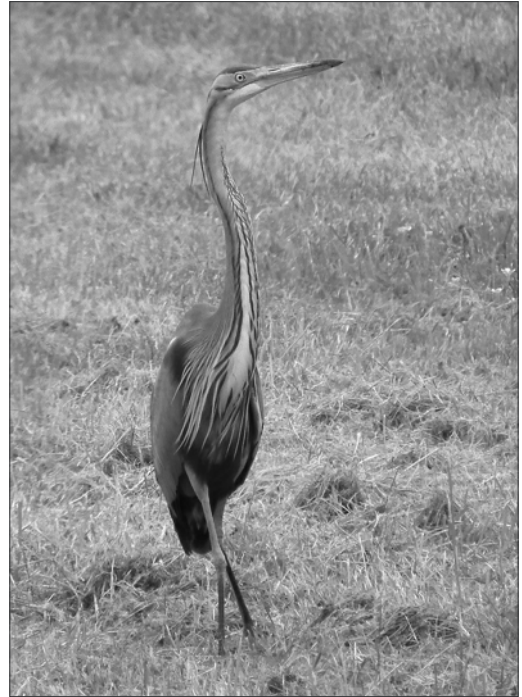
Le Héron pourpré est discret et souvent observé au gagnage ; il est généralement difficile de définir son statut de reproducteur ou de simple estivant sans observations soutenues et répétées.

Les effectifs cumulés de 6 dortoirs recensés en décembre-janvier sont de seulement 260 ind.