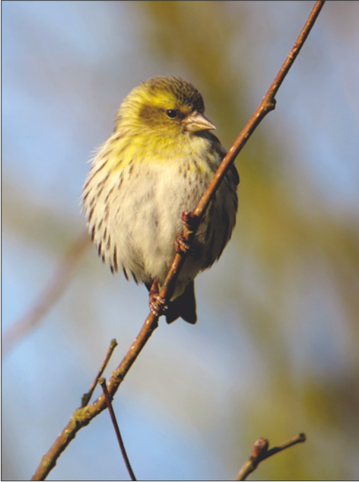
Le littoral sud des Landes est un endroit exceptionnel pour observer la migration diurne, p. ex. 800 Tarins des aulnes le 30 octobre 2015.