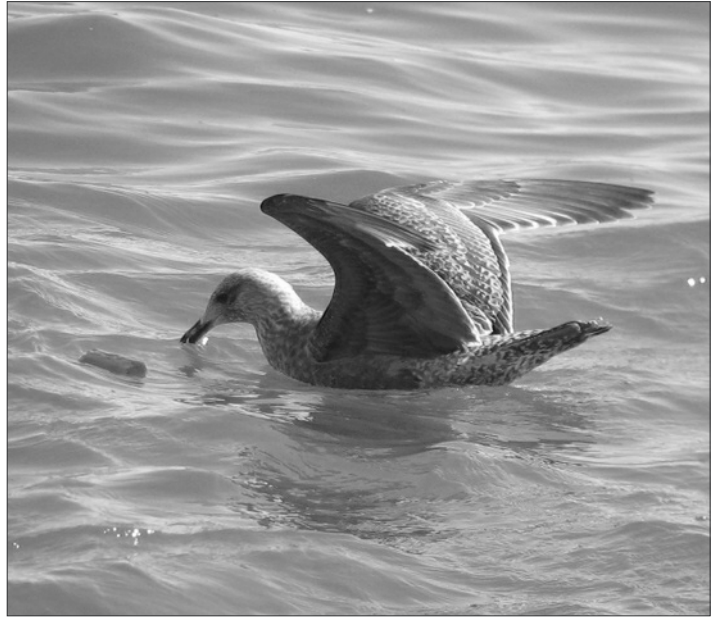
Goéland d'Amérique observé à Txingudi du 04 au 08 mars 2015.

Un ind. de 2 ème année est présent du 4 au 8/03 en baie de Txingudi (APo, FCa, IGU), première mention pour le bassin de l'Adour.