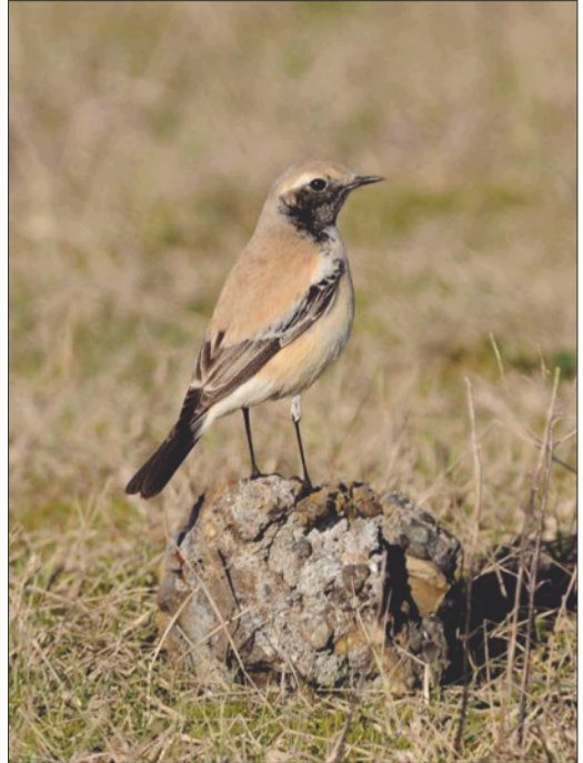
Traquet du désert : jeune mâle ayant hiverné à Tarnos du 22 décembre 2014 au 29 mars 2015, première donnée pour le Bassin de l'Adour.

Un mâle de Bergeronnette printanière ssp iberiae s'est cantonné sans résultat à Orx ; la population la plus proche (composée d' iberiae , de flava et de flava x iberiae ) se trouve au Bassin d'Arcachon.