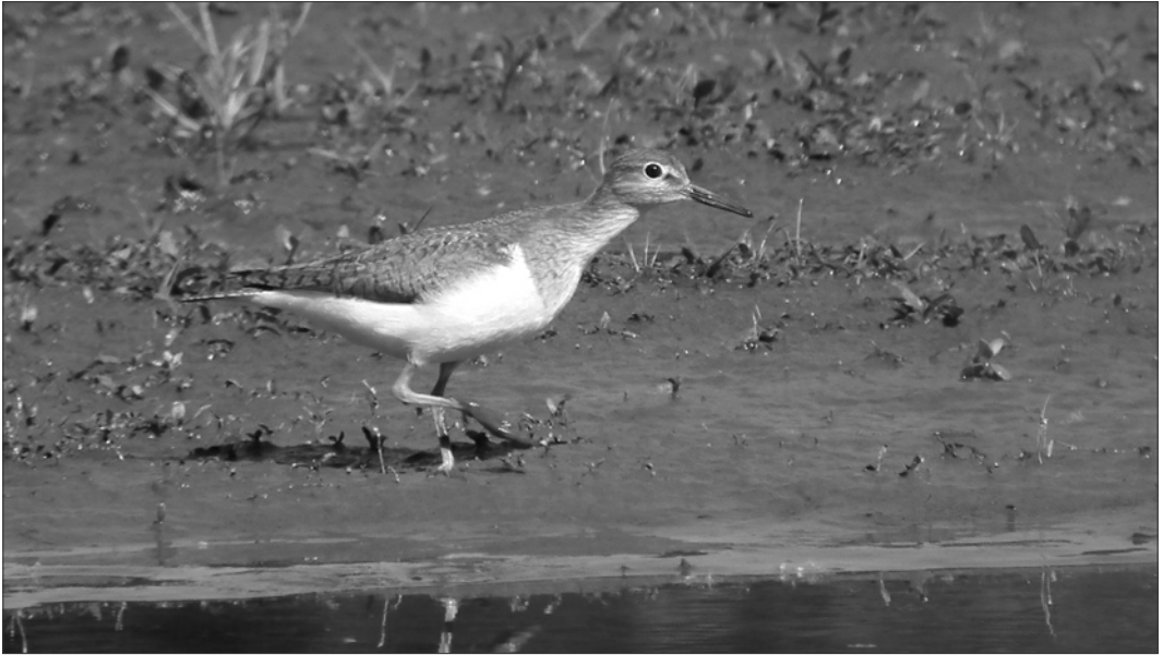
Chevalier guignette : des chants et parades sont observés à Bours à 18 jours d'intervalle, ce qui peut exclure un simple migrateur démonstratif, mais le cantonnement sera sans suite (photo S. PÉRÈS).

Arrivée des premiers migrateurs pré-nuptiaux dès le 3/03 à Puydarrieux (VDu) ; le dernier le 25/05 à Orx (APo, PDV). Les premiers retours sont signalés le 3/07 à Puydarrieux (VDu), la migr. se déroulant sur la côte et dans les terres avec des max. de 11 ind. le 8/08 à Puydarrieux (VDu) ; derniers notés le 15/09 à Orx (FCa).