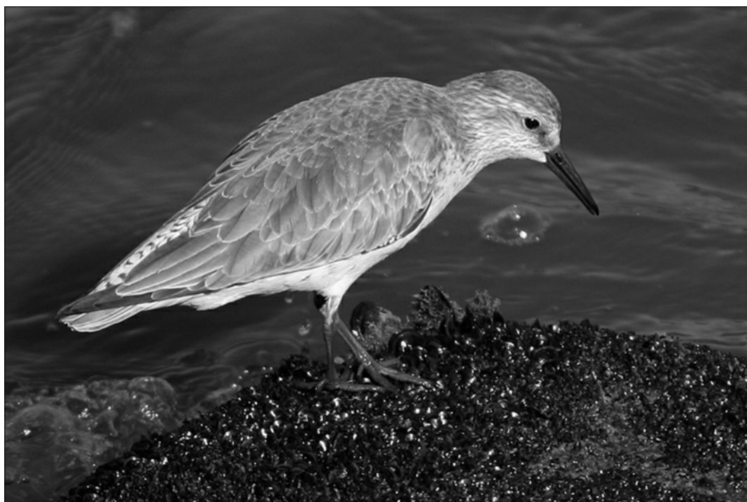
Bécasseau maubèche observé à Capbreton le 13/02 : l'hivernage de cette espèce sur nos côtes n'est pas fréquent