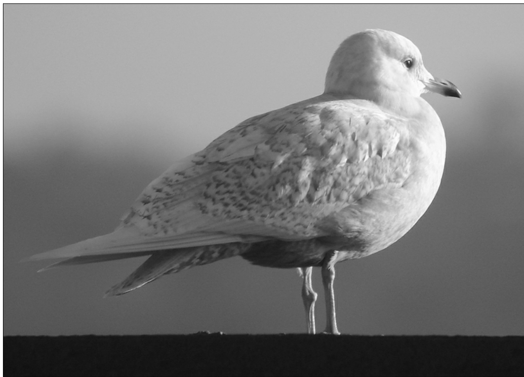
Le Goéland à ailes blanches est une espèce occasionnelle sur notre littoral mais les tempêtes de janvier ont permis d'observer une dizaine d'oiseaux différents

Rares observations hivernales, en petit nombre, en provenance de Capbreton, Anglet et Saint-Jean-de-Luz (FCa, STi, PUT). Passage est décelé à partir de fin mars avec des maxima de 27 individus à Vieille-Saint-Girons le 4/05 (STi), secteur où l'espèce est observée régulièrement en été : par exemple, 16 oiseaux les 12 et 25/07 (CGu). Passage postnuptial les 29/08 à Hendaye, 12/09 à Mimizan (GDu) ; derniers le 10/10 à Mimizan (FCa). Aucune observation à l'intérieur des terres en 2009.