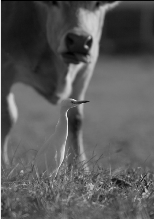
Héron garde-boeufs : les vagues de froid sont toujours un écueil majeur pour cette espèce indo-africaine (P. NAVARRE)

(JmF). La dispersion postnuptiale est assez peu marquée : 1 oiseau en vol nocturne à Bénéjacq le 01/07 (JIG), maximum de 20 individus à Orx le 27/08 (JIG), sur le lac de l'Ayguelongue avec 3 adultes les 30/07 (SDu), à Orx, Seignosse et Hendaye courant août (GDu, AHG). La migration active est notée à Cieutat le 29/08 (FBa, JmF), à Clarac (FBa) et Tournay (JmF) en septembre. Une donnée remarquable le 08/09 à Larrau à 1200 m d'altitude démontrant que la migration pour cette espèce peut se faire par les cols pyrénéens (STi).