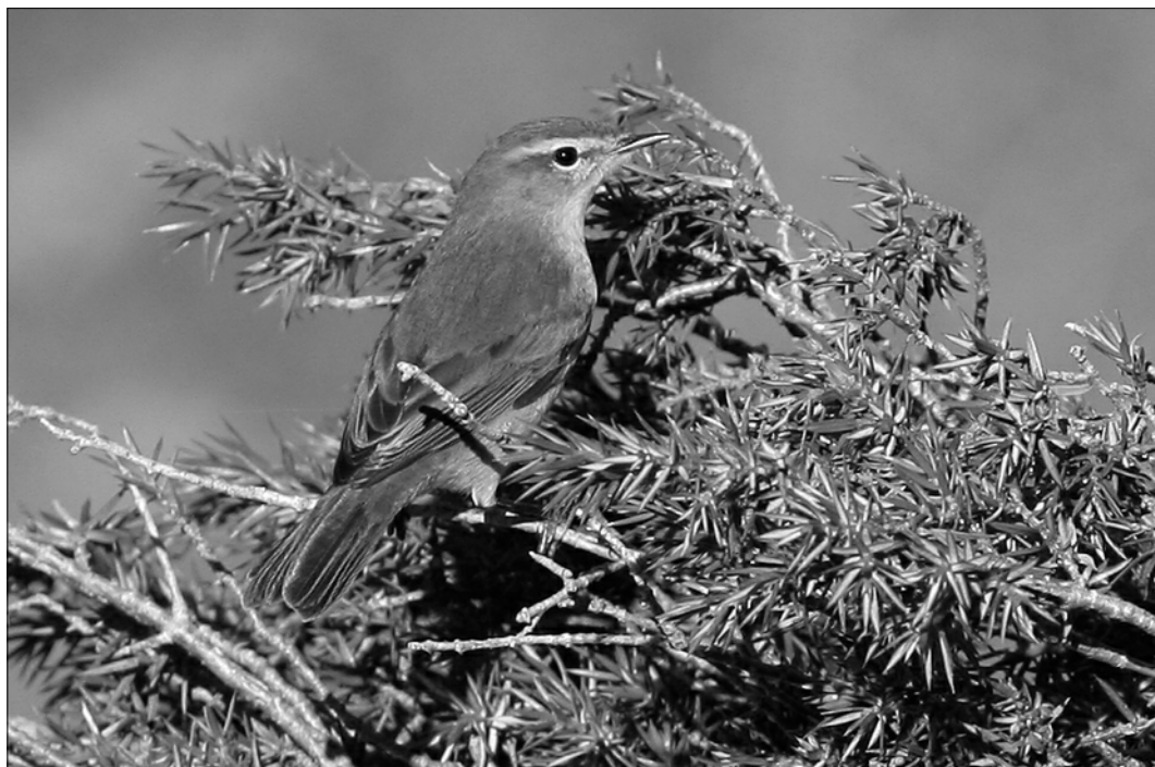
Les premiers chants soutenus du Pouillot véloce débutent en février, occasionnellement plus tôt selon la douceur de l'hiver (P. NAVARRE)

En 2009, contacté en mai et juin dans les localités suivantes : Biriadou (FCa, ANe), Ascain (FCa), Arbailles (JIG), Aldudes (JIG, JmT), Itxassou (PLe). Des individus au chant intermédiaire sont contactés à Biriadou (FCa) et aux Aldudes (JIG, JmT). Un chanteur noté le 9/04 à Abbadia (Hendaye) devait être un migrateur (AHG).