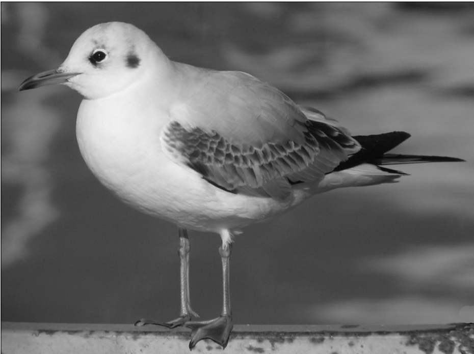
La Mouette rieuse se reproduit à Artix mais les variations du niveau des eaux limitent chaque année le succès reproducteur