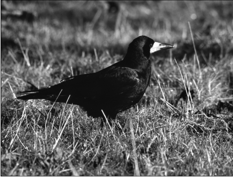
Les observations de Corbeau freux sont très localisées dans le bassin de l'Adour, provenant chaque année des mêmes communes (J.-M. FOURCADE)

tous décrit ainsi. En leur faisant passer le « Guide Ornitho », une par une pour qu'il n'y ait aucune influence entre elles, elles ont été formelles et se sont arrêtées à la page du casse-noix ».