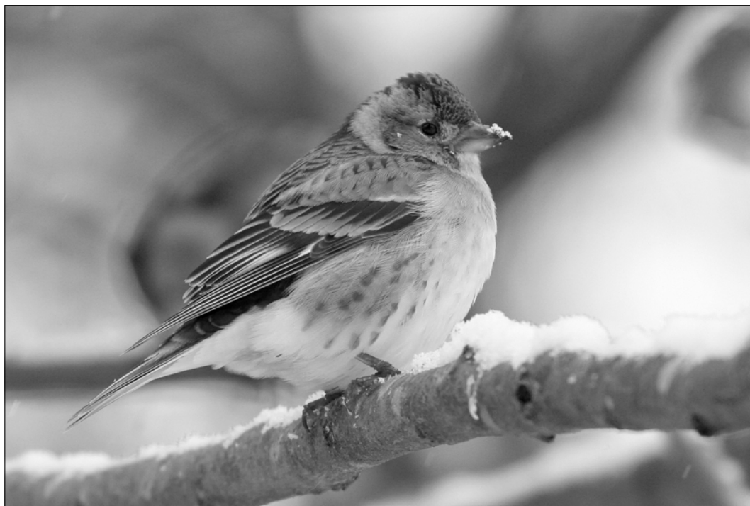
Nouvel hivernage massif du Pinson du Nord avec un immense dortoir collectif à Gan

11/03 (MGu); 2 ind. migrent encore à Capbreton le 9/04 (STi). Juvéniles observés à Espoey le 22/05 (SDu), Bayonne le 4/06 (FCa), Ibos (ANa), Morcenx (PUT) et Lescun (NeA). Rassemblements postnuptiaux de 40 oiseaux à Campan le 5/09 (JIG), 66 à Bilhères-en-Ossau le 14/09 (CGo) et 25 à Tarnos le 9/10 (FCa).