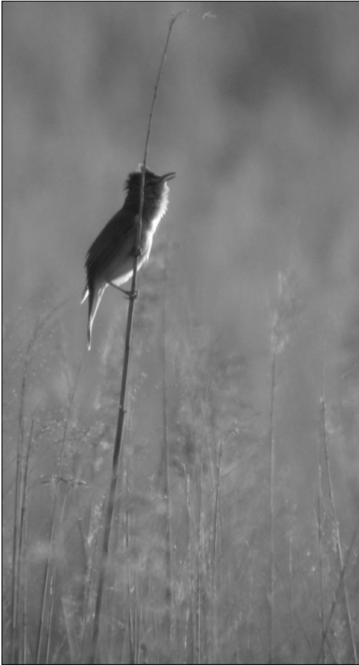
Rousserolle turdoïde : un chanteur de passage entendu à Abos ; la dernière preuve de reproduction remonte aux années 80 (J.-M FOURCADE)

Laurent-de-Gosse (FCa, SLe). En période de reproduction, chants entendus du 28/02 au 2/09 (coll. GOPA) montrant l'amplitude de cette phase de vie chez la cisticole ; 3 juvéniles volants le 18/08 à Tarbes (CHo) ; à noter un chanteur à La Madeleine (Tardets-Sorholus, 630 m) le 2/09 (SDu).