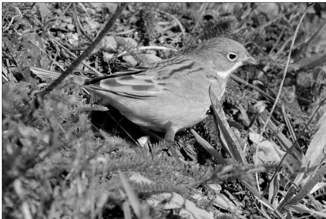
Bruant ortolan en halte migratoire à Payolle le 5/09, date classique pour le passage d'automne