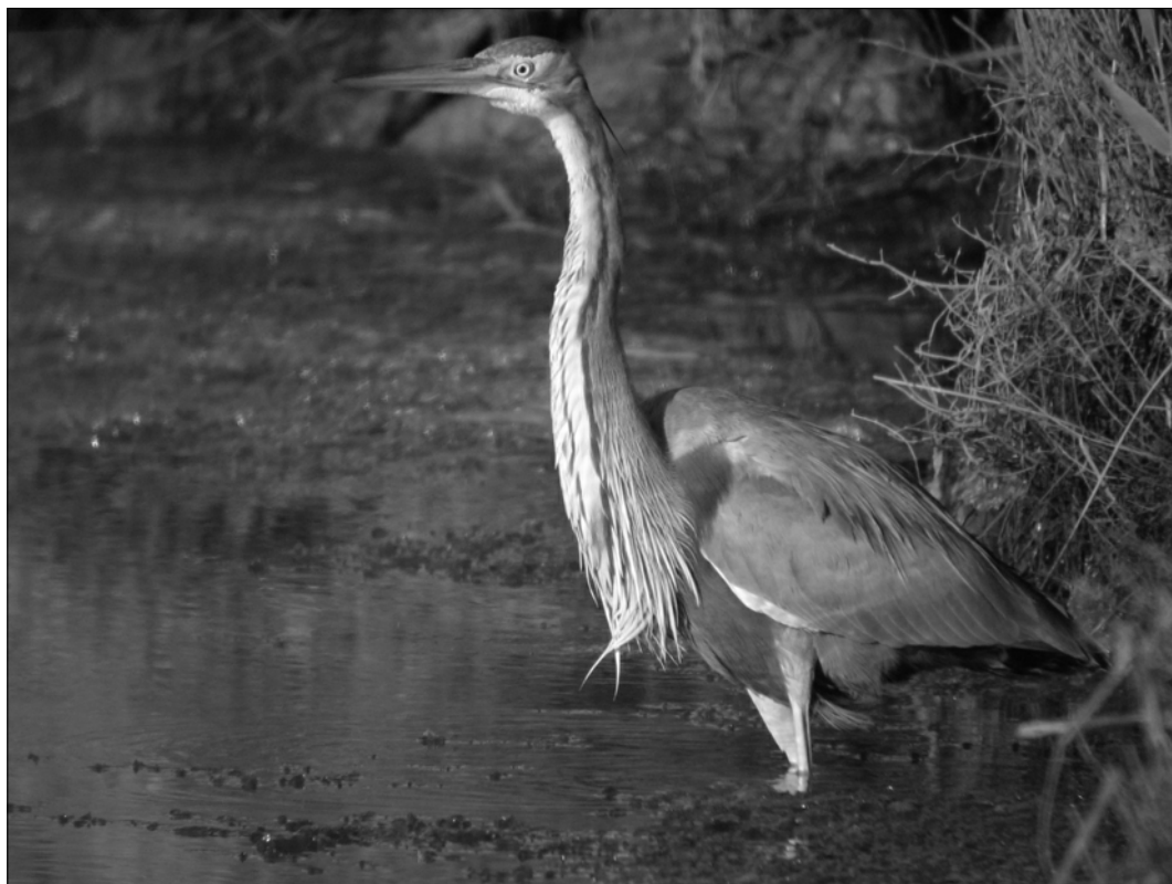
Le Héron pourpré a été trouvé nicheur sur 3 sites en 2009. Des prospections ciblées sur la côte landaise permettraient d'affiner nos connaissances sur les effectifs réels de la population reproductrice (J.-M. FOURCADE)

ne-d'Orthe où la reproduction est très probable (SDu).