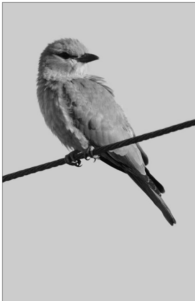
3 nouvelles données de Rollier d'Europe pour les Hautes-Pyrénées, dont cet oiseau présent en août à Moulédous

L'espèce a été contactée sur 22 communes en hiver (novembre-février) avec un maximum de