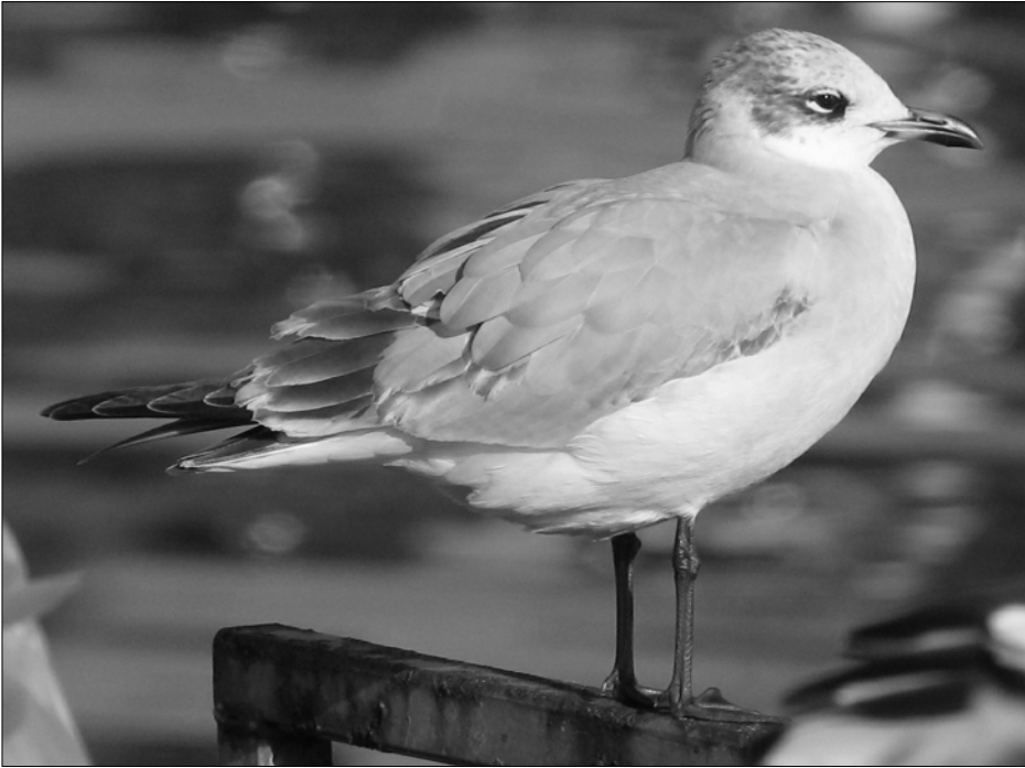
La Mouette mélanocéphale est rare à l'intérieur des terres, où elle est surtout observée au printemps