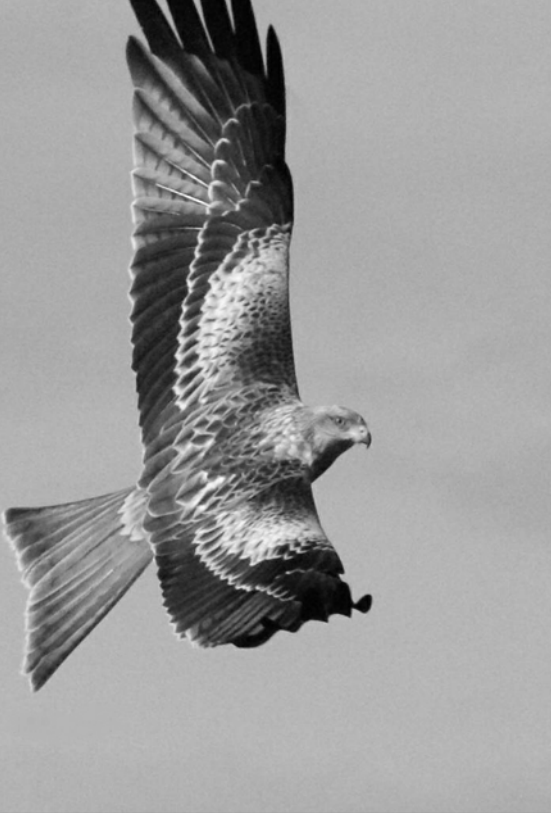
621 Milans royaux hivernants recensés dans les Hautes-Pyrénées (A. NERRIÈRE)

Premiers migrateurs postnuptiaux le 23/07 au col de Soulor (JIG) puis les 31/07 sur le même site (JIG) et 1/08 au col des Palomières (SPé) ; jusqu'à 380 individus en 2h00 le 22/08 à Asasp-Arros (SDu), 161 le 23/08 à Trébons (DRa), 690 le 26/08 au col de Soulor (JIG), 193 en 2h30 le 5/09 au col des Palomières (JmF) ; derniers migrateurs les 1/10 sur le lac de l'Ayguelongue (EDu), 3/10 au col de Soulor (JIG) et 9/10 à Bilhères-en-Ossau (CGo).