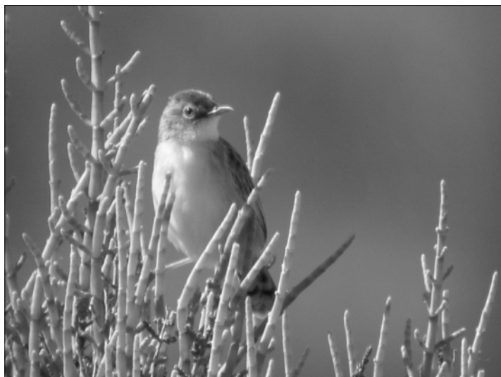
Cisticole des joncs : les données quantitatives sont à privilégier pour cette espèce prolifique dont les variations interannuelles d'effectifs peuvent être importantes (J.-M. FOURCADE)

reproduction à 1300 m à Iraty (STi, BCo) et Borce (NeA) et 1400 m à Laruns (BCo). La migration postnuptiale est décelée dès le 26/09 au col de Soulor, avec le passage de 9 individus (CGo).