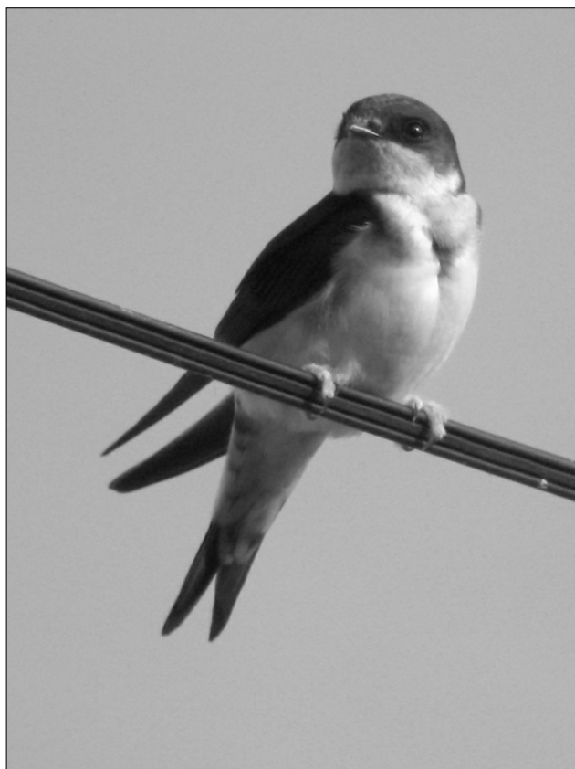
Nicheuse à haute altitude, l' Hirondelle de fenêtre y retrouve son habitat originel de falaises rocheuses

Trois migrateurs tardifs à Bours le 2/11 (SPé). Retours le 15/03 à Ossun (JIG) et Bours (SPé),