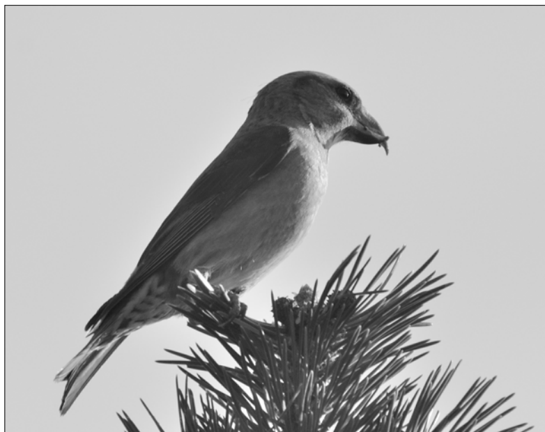
5 Beccacroisés des sapins vus à Seignosse le 16/06 : cette observation est l'occasion de rappeler la reproduction de l'espèce à Anglet en avril 1984 (J. BOUILLERCE)

une probable troupe de 10 attardés à Itxassou le 6/05 (ANe). Les premiers chants sont détectés en mars, le 1 er à Besingrand (JIG), le 15 à Salles (PMi) ; l'espèce est contactée chanteuse sur 29 communes. Des preuves de nidifications sont apportées à Uhart-Mixe avec la construction d'un nid par une femelle le 10/05 (SDu, JBo) et à Luquet avec des juvéniles volants le 7/08 (JIG). Des rassemblements familiaux sont observés à l'automne : 15 le 10/09 à Larrau (STi), 7 à Aydius le 28/10 (NeA) sans toutefois pouvoir distinguer les bruants locaux et ceux issus de la migration. L'espèce est observée jusqu'à 2100 m d'altitude le 27/09 à Estaing (ALe).