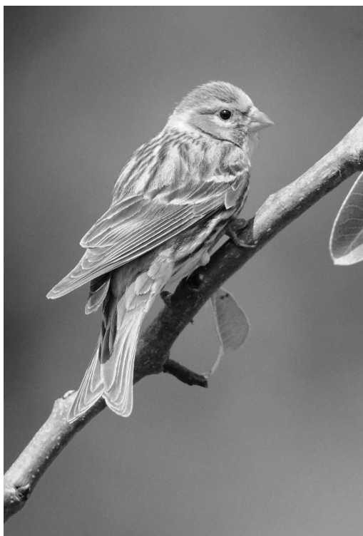
Le Serin cini forme régulièrement des groupes de quelques dizaines d'individus en automne, notamment en montagne

(Urdos), Peyreget (Laruns) (SDu), col de Soulor, col de Spandelles, col de Beyrède (JIG), Néouvielle avec 22 oiseaux le 30/06 (JIG). Sur le littoral, l'espèce est contactée en juin-juillet à Léon, Moliets-et-Maa (PLe) et Ondres (SDu). Déplacements postnuptiaux observés dès le 27/08 au col des Palomières (SPé), les 4 et 8/09 à Orx (SDu, SHo, FCa, JBo), 10/09 à Oloron-Sainte-Marie (SHo), 14/09 à Bours (SPé) et à 4 reprises à Ustaritz en septembre (BLa).