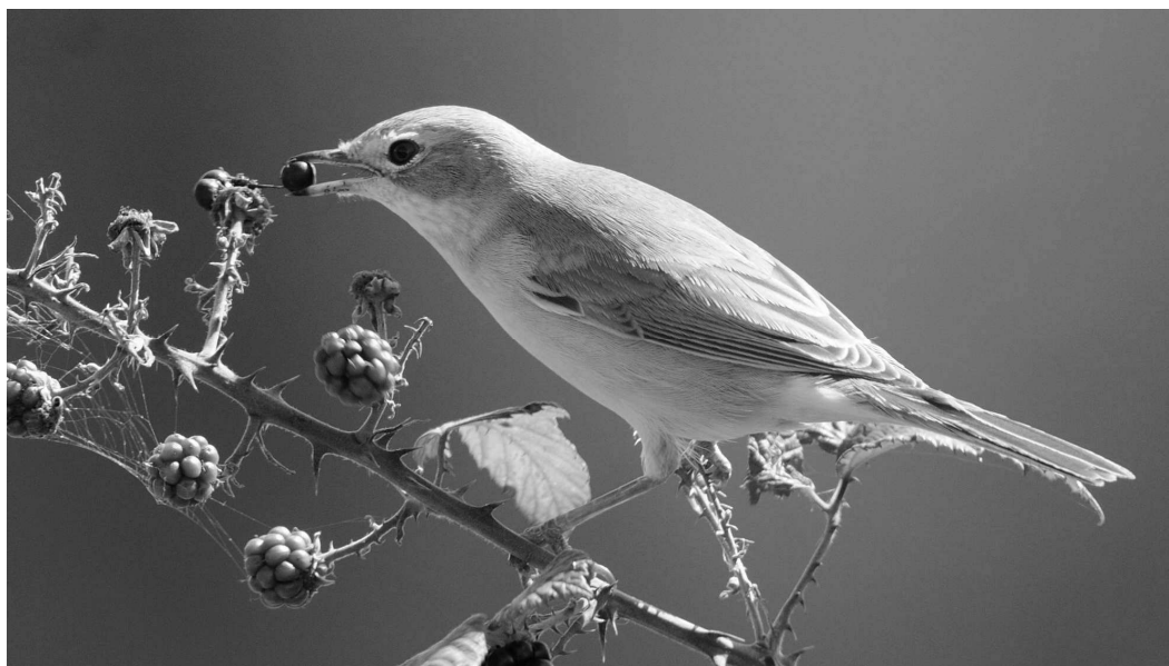
Deux retours très précoces de Fauvette grisette , les 06 et 08 mars sur la côte basque, alors que les premiers arrivants ne sont habituellement détectés qu'au cours de la dernière semaine de mars

(JIG). Dernières les 3/10 à Puydarrieux (VDu) et 4/10 à Ger (JIG).