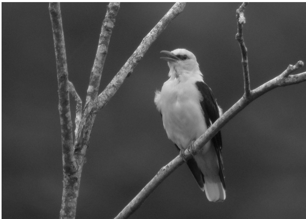
Un Loriot d'Europe observé le 05 octobre dans le Gers, date très tardive : les départs s'achèvent généralement dans la première moitié de septembre

dans le secteur d'Occabé, Estérençuby (BLa). Dans les Hautes-Pyrénées, présence notée sur les communes de Bagnères-de-Bigorre (DRa), Ancizan (STi), Campan et Sirieix (JIG). Les premiers chants sont signalés le 27/02 à Saint-Pé-de-Bigorre (SDu, JmT).