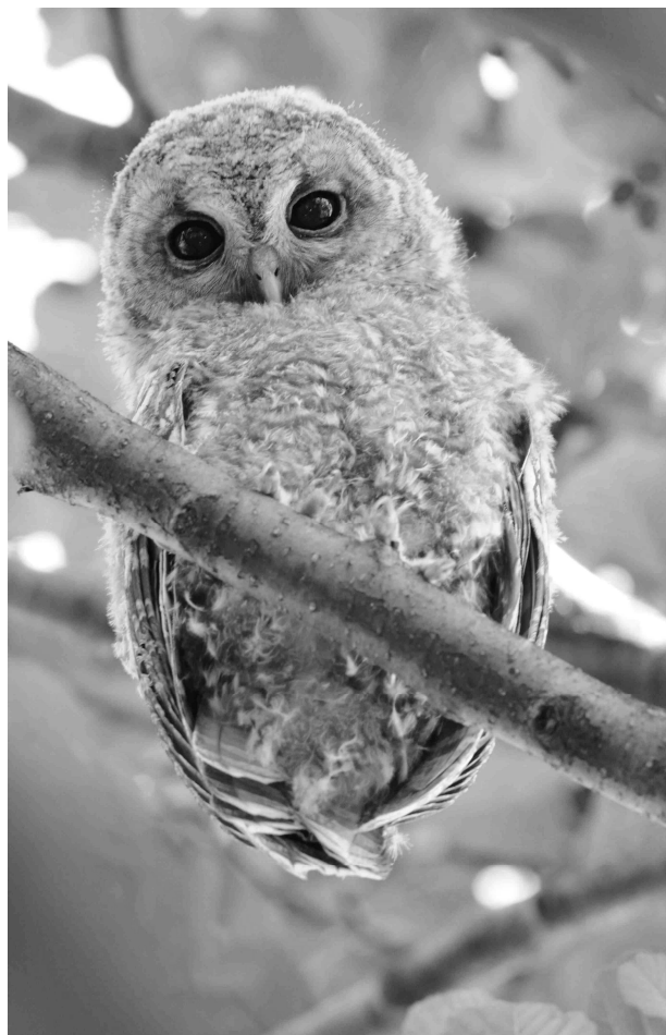
La Chouette hulotte se rencontre jusqu'à la limite supérieure des forêts

Premiers retours printaniers le 31/03 à Esquiule (SHo) puis les 2/04 à Orx (FCa), 4/04 à Boucau (ECh), 7/04 à Artix (JIG) et 13/04 à Aureilhan (DRa). En période de reproduction, des accouplements en vol sont notés à Aureilhan les 2, 5 et 9/05 (DRa), à Meillon le 5/05 (JIG) et à Ayros-Arbouix le 26/05 (PMi). Encore des nourrissages au nid le 10/07 à Salles-sur-Adour (DRa). L'espèce se reproduit à Barèges (1200 m), Arrens-Marsous (900m) et Saint-Lary (800 m) (JIG, LCa). Premiers migrateurs postnuptiaux les 8/07 au col de Tourmalet, 19/07 à Bénéjacq (JIG) avec plusieurs milliers le 28/07 à Lescun (NEa) et 3500-4000 le 30/07 au col de Soulor