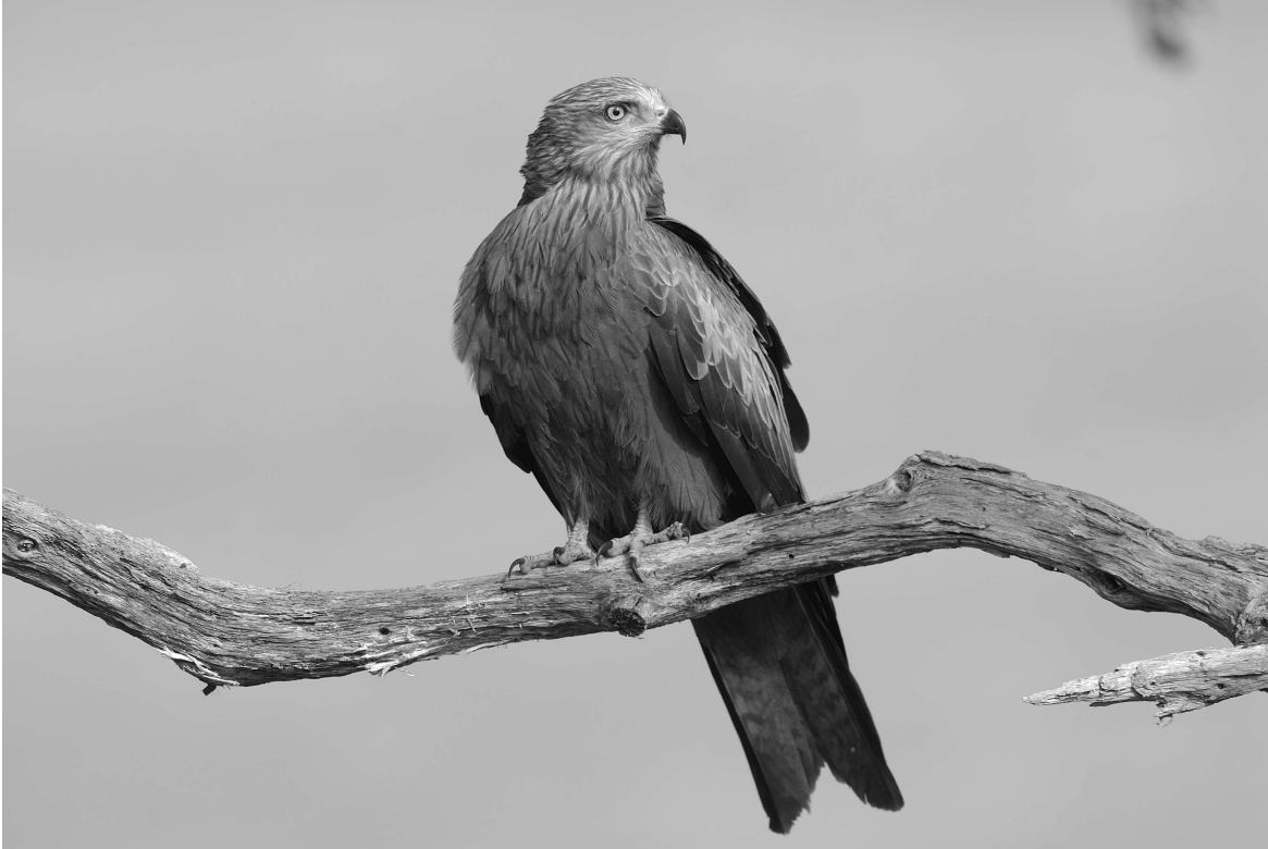
Le Milan noir est une espèce très commune le long de l'Adour et des gaves. Notre région accueille ainsi une part significative de la population nicheuse française