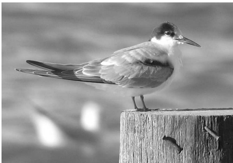
Dans le Bassin de l'Adour, la Sterne pierregarin est l'espèce la plus contactée parmi les sternes et guifettes, à égalité avec la Caugek.

reposoir, le 28/01 (FCa) et 125 à Hendaye le 26/02 (AhG). Les effectifs chutent rapidement au début du mois de mars, les dernières mentions étant du 26/03 à Seignosse-le-Penon (A. Le Calvez – ObsAquitaine) et du 30/03 à Plaiaundi (ECh). Des migrateurs sont signalés le 15/03 à Saint-Laurent-de-Gosse, le 16/03 à Rivière-Saas-et-Gourby (FCa, SLe) et le 25/03 à Puydarrieux (VDu), seule mention loin à l'intérieur des terres. Quelques observations en période de reproduction : 2 adultes en vol vers le Nord le 12/05 à Lit-et-Mixe (SHo), 1 juvénile le 27/06 à Hendaye et 1 (âge non précisé) le 24/07 sur ce même site (AhG). Retours en faible nombre à partir du 6/09 à Labenne (SHo, ECh).