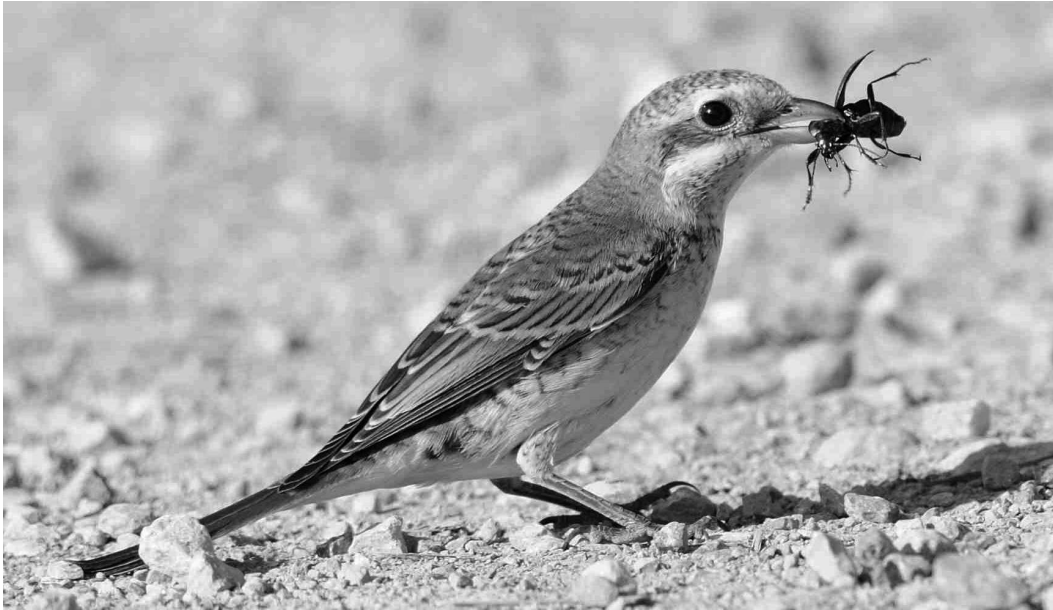
Les zones ensoleillées du piémont pyrénéen et des vallées offrent encore des conditions très favorables à la Pie-grièche écorcheur , espèce en déclin marqué en France