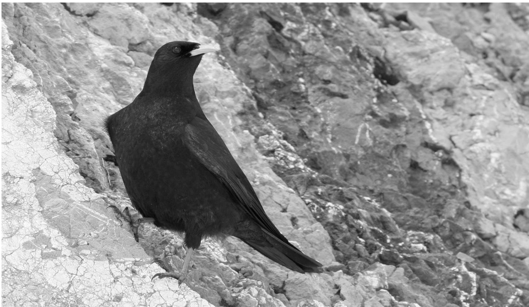
Si le Chocard à bec jaune descend en hiver jusqu'aux entrées de vallée, il ne s'aventure pas vers la plaine