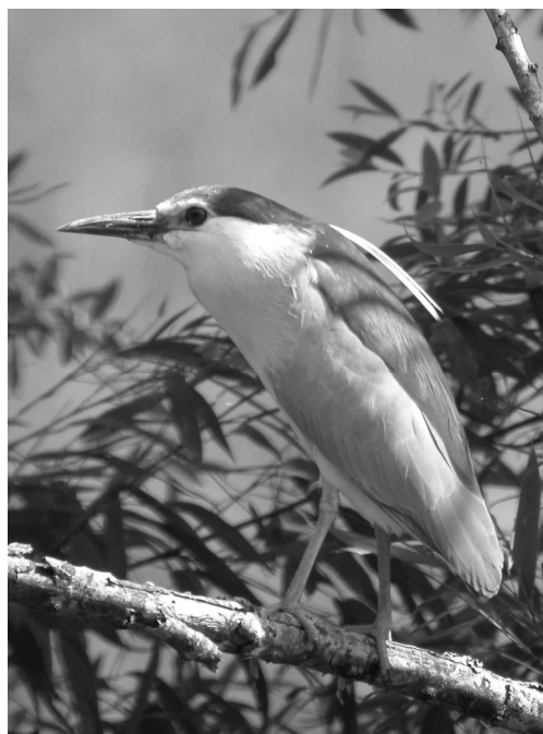
L'hivernage du Bihoreau gris est solidement établi dans la région, mais les effectifs (stables) restent modestes

En hiver, présente à Sère-Rustaing avec 17 le 18/11 (FBa), Puydarrieux avec 21 le 16/12 (VDu), Biron avec 5 le 12/01, Artix avec 15 le 12/01 (coll. GOPA), sur le lac du Gabas avec 3 le 17/01 (SDu), à Saint-Martin-de-Seignanx avec 8 le 7/12 et Orx avec 8 le 17/12 (FCa, XBa). Les départs s'étalent de mars (10 données) à juin (2 données) avec un individu stationnant sur la lande de Ger du 14/05 au 1/06 (JIG) ; en juillet-août, l'espèce est observée à Pontonx-sur-l'Adour (GLa) et dans les barthes de Rivière-Saas-et-Gourby (FCa), tous sites favorables à la reproduction mais sans indice probant. Par contre, un individu en plumage nuptial a été observé à Orx mi-mars en compagnie de 2 autres