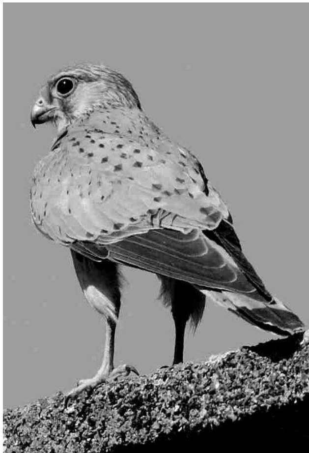
Le Faucon crécerelle est une espèce connue pour ses grandes capacités d'adaptation. Elle se reproduit avec succès à plus de 2000 m dans les Pyrénées occidentales : l'étude d'une population montagnarde dans les Pyrénées reste à faire