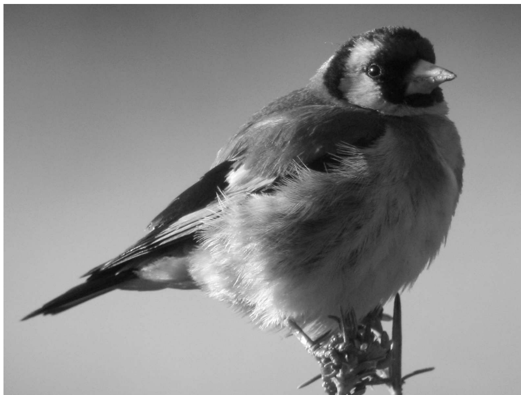
Comme en témoigne l'observation de nourrissages à Gerde le 1 er septembre, le Chardonneret élégant , à l'image d'autres fringilles sédentaires, étale jusque tard en saison sa période de reproduction

les 15/04 à Meillon (JIG), 18/04 à Yzosse (FCa) et à Arjuzanx (PUT). Un individu observé à La Pierre-Saint-Martin le 13/05 peut être un nicheur potentiel ou un attardé (SDu, PNa). Retours postnuptiaux dès le 1/10 à Moliets-et-Maa avec 11 individus (PLe) puis les 6/10 à Puydarrieux (VDu), 7/10 à Laslades (FBa), Labenne avec 30 oiseaux (FCa) et Momas (SDu). Groupe de 80 observé au col des Palomières le 22/10 (SPé).