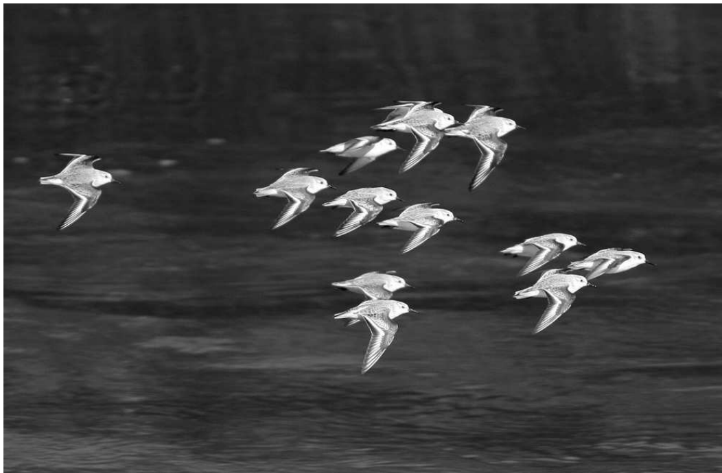
Le Bécasseau sanderling est une espèce littorale peu répandue dans notre région : la côte rocheuse basque exclut ce limicole attaché aux substrats sableux

du 2 au 5/09 (FCa) puis 2 les 6 et 7/09, un seul ensuite jusqu'au 11/09 (FCa, SHo, ANe, ECh et al. ) ; 2 au lac de l'Ayguelongue du 11 au 14/09 au moins puis 1 jusqu'au 23/09 (JIG, SDu et al. ) ; 1 à Puydarrieux du 11 au 18/09 (VDu).