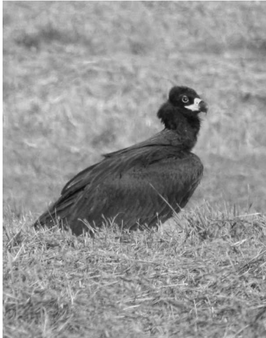
Vautour moine photographié à Peyrehorade (Landes), le 10 novembre 2006, constituant la première donnée pour ce département

dans les Pyrénées-Atlantiques et 6 dans les Hautes-Pyrénées). Recharge d'aire le 19/11 en vallée de Luz (SDu, Pfo), couvaison les 19/01 et 27/02 près de Lourdes (SDu, JmT). Trois adultes sont observés simultanément les 30/04 à Arudy (SDu) et 18/06 à Sarrance (SHo). Un immature n'ayant plus qu'une seule plume caudale est observé en haute vallée d'Aspe le 1/08 (SHo).