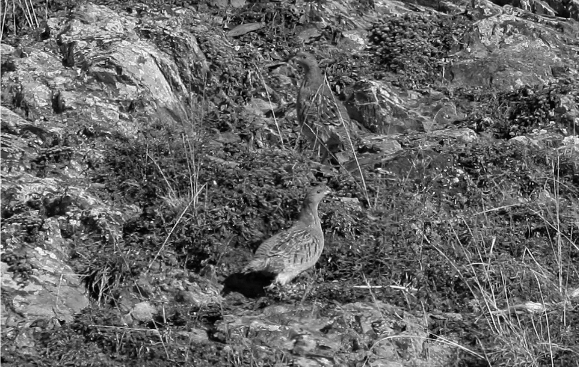
Oiseau strictement montagnard, la Perdrix grise pyrénéenne se rencontre au-delà de 1000 m d'altitude, atteignant le subalpin supérieur

Erismature rousse Oxyura jamaicensis (d=2) Deux femelles sont présentes le 12/01 à Vielleségure (SHo).