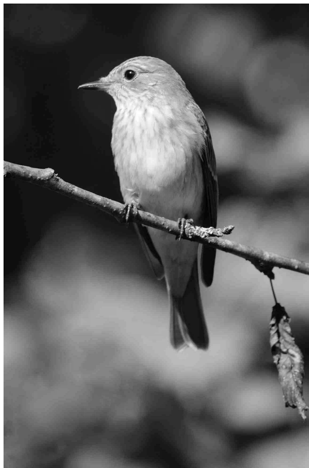
Le Gobemouche gris est un nicheur peu commun des boisements clairs de plaine

Mésange bleue Cyanistes caeruleus (d=75)