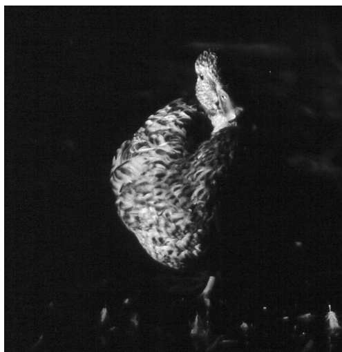
Nouvelle reproduction du Canard Colvert à l'étage montagnard, au lac de Soum