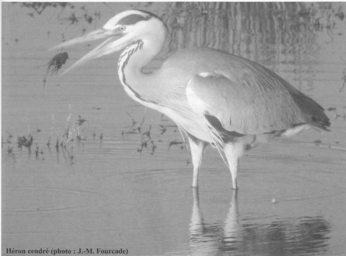
Héron cendré

En expansion dans notre région où il s'est sédentarisé, les rigueurs de l'hiver sont pour lui un écueil qui peut décimer ses populations (Duchateau, 2002).