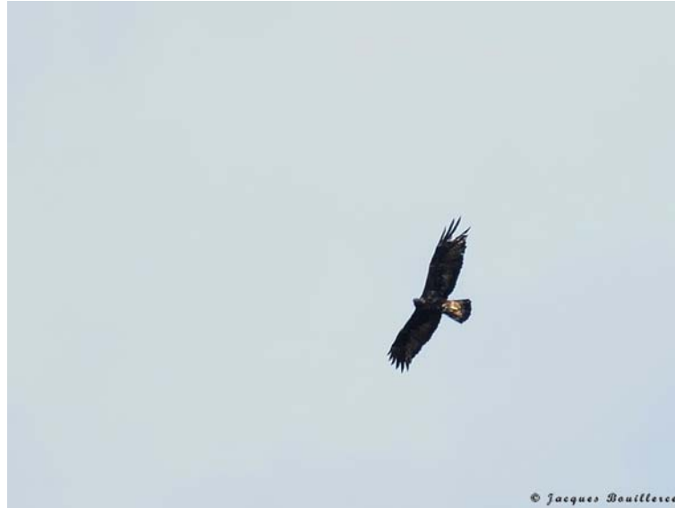
Aigle royal adulte mâle du couple territorial