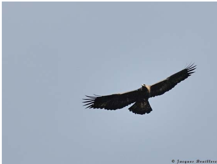
Aigle royal adulte femelle du couple territorial

Nous n'observerons aucun autre aigle sur le secteur pendant l'heure qui suit, et, au cours des observations ultérieures, nous verrons le couple adulte occuper, seul, le site.