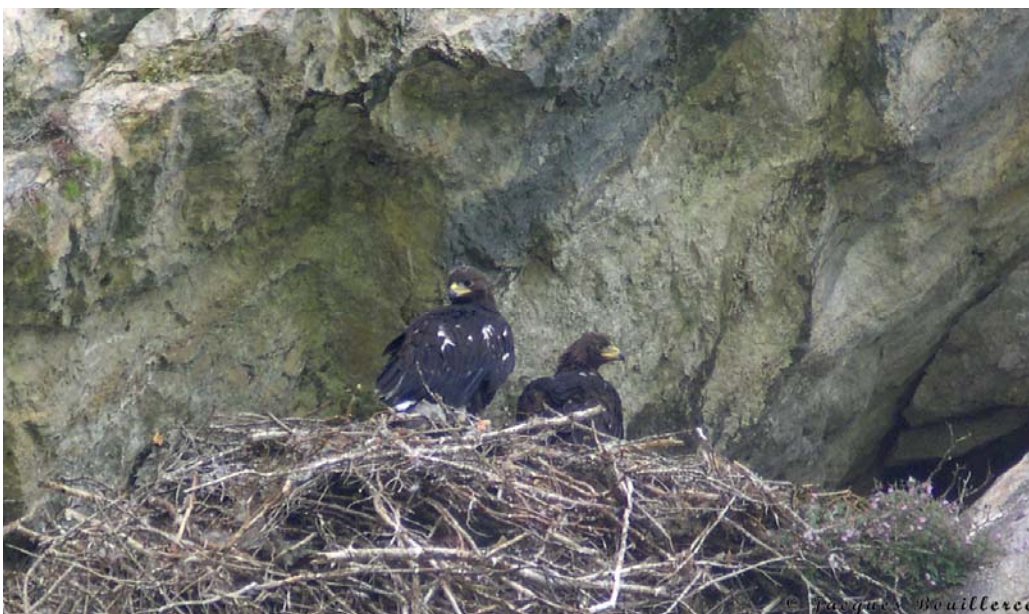
deux aiglons dans le nid principal à quelques jours de l'envol 2007