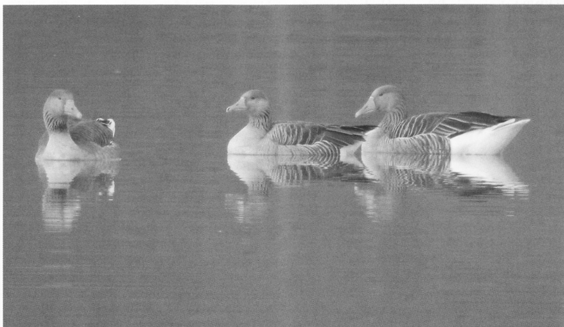
Oies cendrées

Situé sur une des plus grandes voies migratoires d'Europe, le marais d'Orx est amené à jouer un rôle important en matière de conservation des oiseaux d'eau. L'augmentation rapide des effectifs d'oies hivernantes et le nombre important d'oiseaux présents en hiver témoignent bien de cette importance et de la nécessité de mettre en œuvre des mesures de gestion cohérentes.