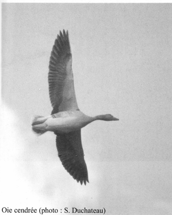
Oie cendrée

Aujourd'hui, nous savons que la qualité de la reproduction des Anatidés en général et des oies en particulier est conditionnée par la qualité des conditions d'hivernage de ces oiseaux. Aussi est-il important d'intégrer rapidement cette problématique du dérangement des oiseaux au plan de gestion du site qui ne manquera pas d'être présenté au CNPN. La prise en compte de ce facteur pourrait