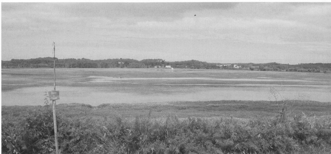
Vue d'ensemble du marais d'Orx

Résumé : La qualité du marais d'Orx pour l'hivernage de l'Oie cendrée Anser anser a été évaluée d'après 3 critères : l'estimation de la quantité de réserves accumulées (analyse du profil abdominal), l'étude de la biomasse consommée et le calcul des taux de vigilance et d'alimentation. Les résultats d'ensemble indiquent que le site est globalement bon. L'étude de la biomasse consommée permet d'affirmer que les oies ont disposé d'une ration suffisante pour emmagasiner des réserves, ce qui est confirmé par l'évolution positive des profils abdominaux. En revanche, la réalisation des budgets d'activité a mis en évidence une différence considérable entre les zones d'alimentation étudiées (polders sud et nord). Le polder nord nécessite un taux de vigilance élevé (14,3), préjudiciable à la qualité de l'hivernage. La chasse, pratiquée assidûment en bordure de ce polder, semble être responsable de ce dérangement. De nouvelles orientations dans la gestion du site sont donc souhaitables car le marais d'Orx peut devenir un site national majeur pour l'hivernage des oiseaux d'eau en général et des oies grises en particulier.